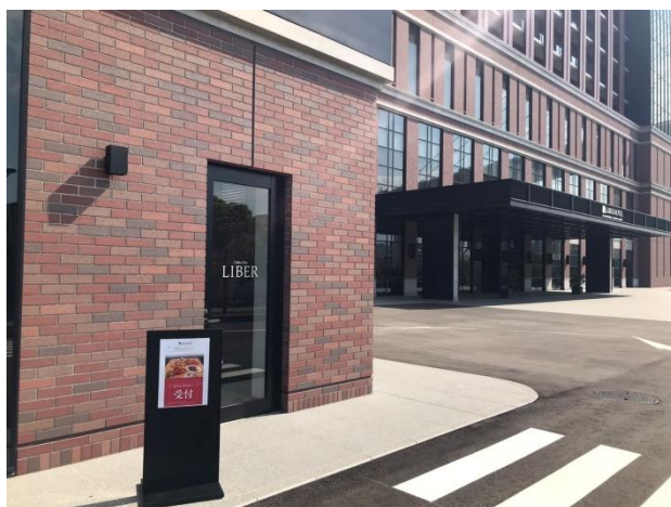
テイクアウトお渡し店舗

お料理のお渡しはお車に乗ったままのドライブスルー形式で行ない、1組様毎にスタッフの手指消毒を行うなどコロナウイルスの感染拡大防止に努めます。(クレジットカード決済をご利用の場合は、店内のレジでご精算していただく必要がございます)