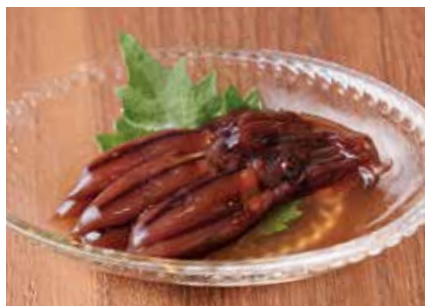
ホタルイカの沖漬け