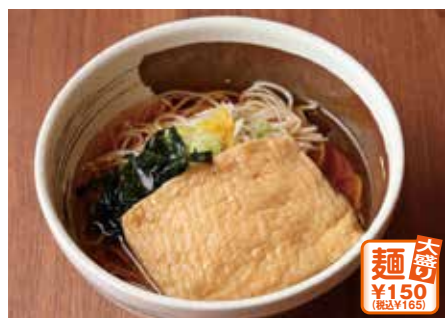
きつねそば(温・冷やがけ)