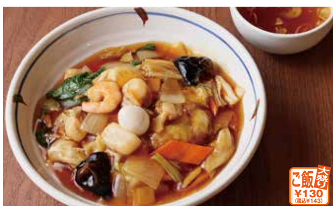
海鮮五目あんかけ丼(スープ付き)