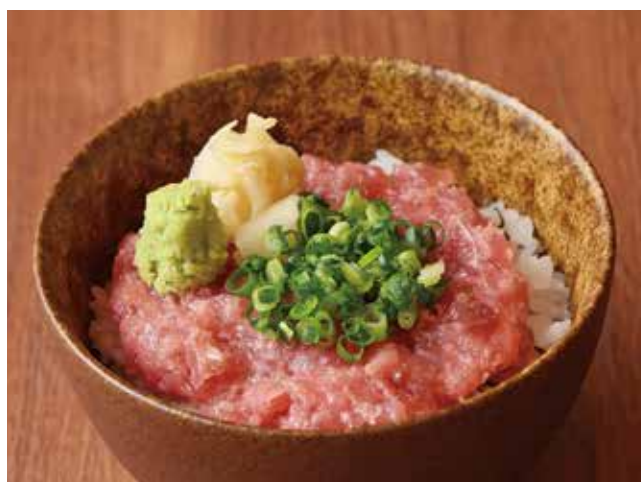
ミニまぐろたたき丼