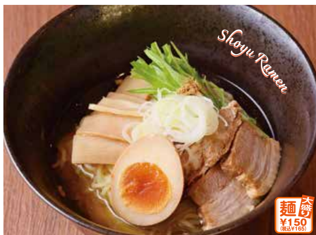
醤油ラーメン(魚粉入り)