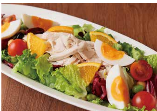
蒸し鶏とたまごのサラダ