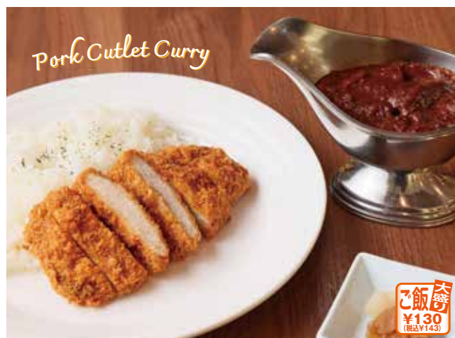
特選豚ロースかつカレー