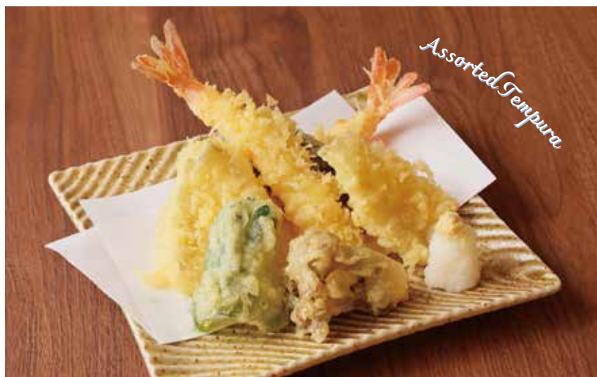
天ぷら盛り合わせ