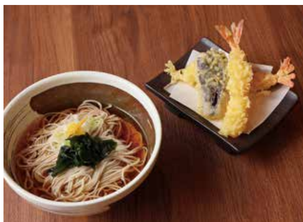
海老天ぶらそば(温・冷)