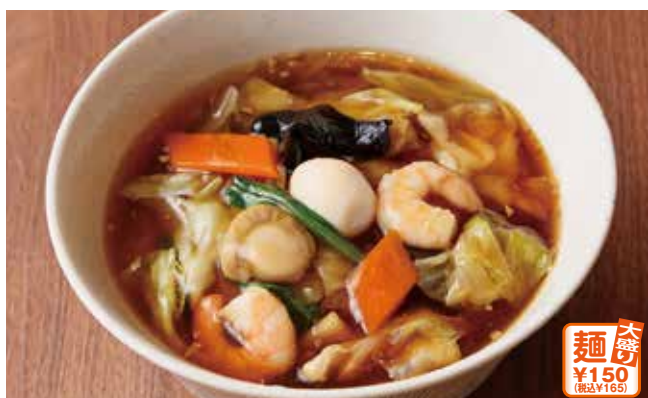
海鮮五目あんかけそば