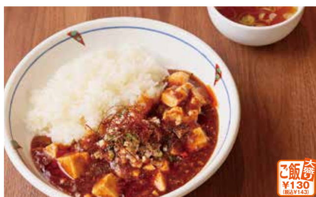
四川風麻婆豆腐丼(スープ付き)