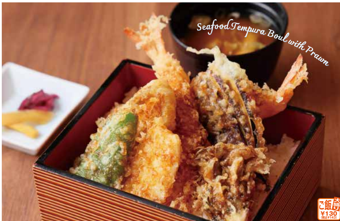
海鮮天ぷら重 (お味噌汁・香の物付き)