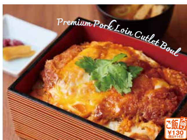
特選豚ロースかつ重 (お味噌汁・香の物付き)