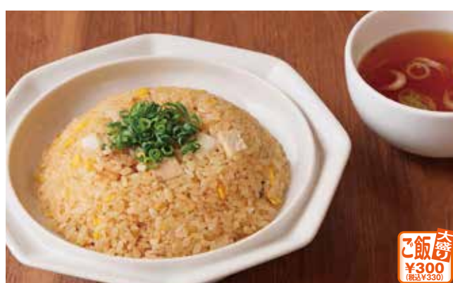
チャーハン(スープ付き)