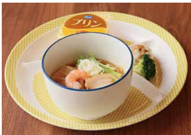
お子さまラーメン