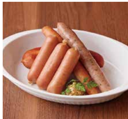
ソーセージ盛り合わせ