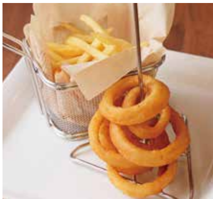
フライドポテト&オニオンリング