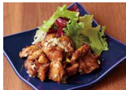
鶏ハラミのネギ塩だれ