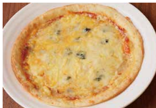
4種のとろけるチーズピッツァ はちみつ添え