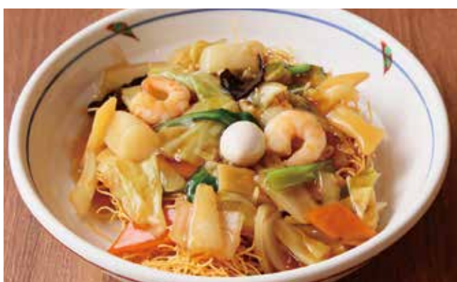
海鮮五目あんかけ皿うどん