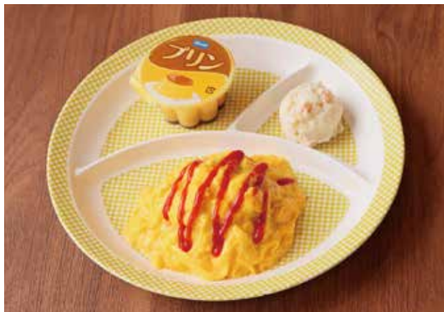
お子さまオムライス