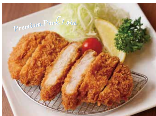
特選豚ロースかつ