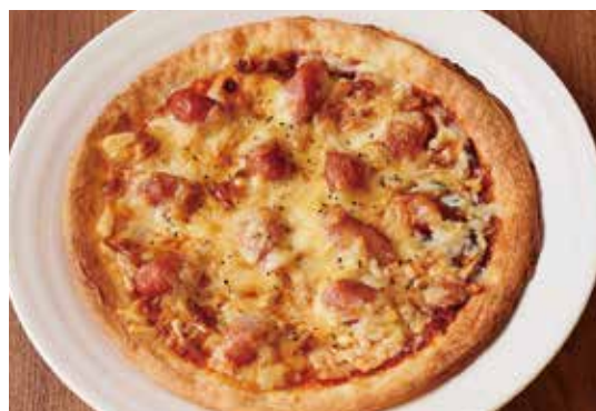
ソーセージピッツァ