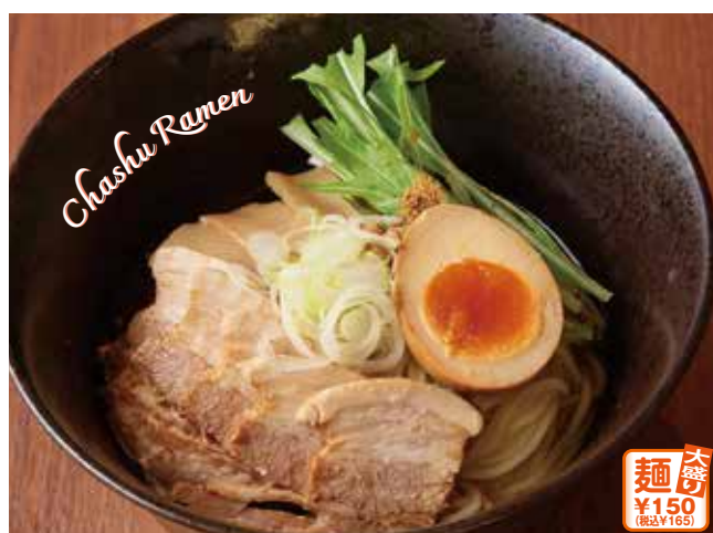
チャーシュー麺(魚粉入り)